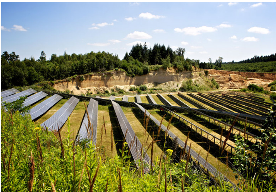
Windwärts Energie GmbH [21]